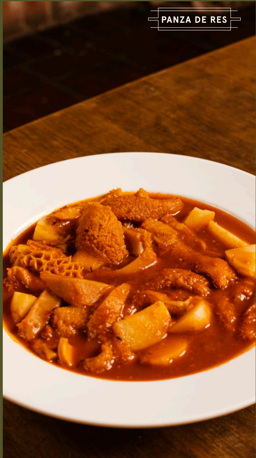
PANZA DE RES