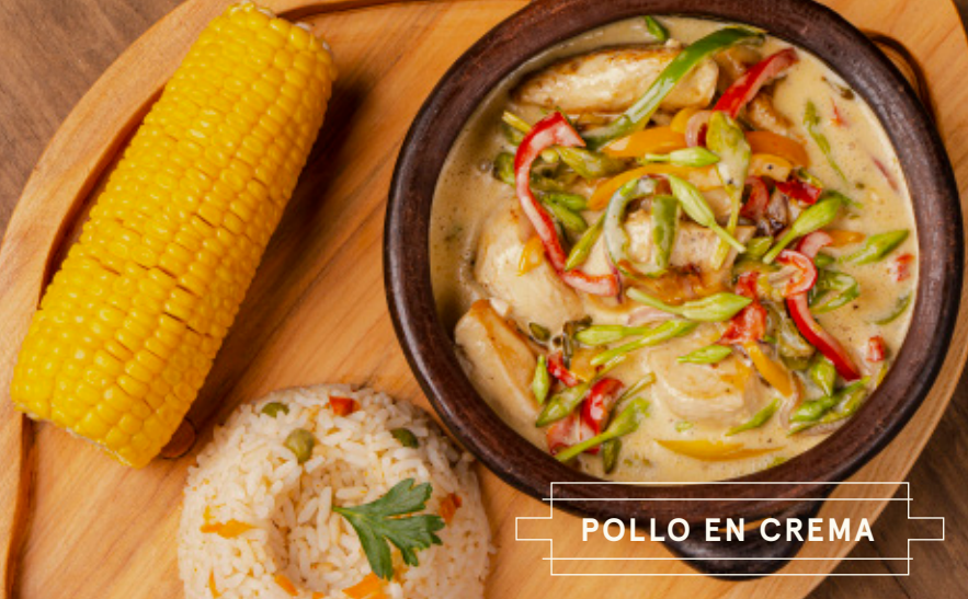
POLLO EN CREMA